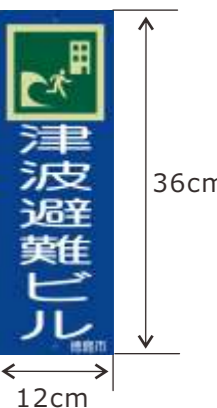
徳島市指定 津波避難ビル プレート

マップ上にある津波避難ビル名称のカッコ内の数字は、想定される津波が襲ってきた場合に、安全な高さにある階（目安は3階以上）の収容可能人数で、1人あたり1m 2 で概算したものです。夜間・休日等に施錠される施設には「かぎ保管庫」が備え付けられています。かぎ保管庫は震度5強以上の揺れを感知すると扉が解錠され、入口の鍵を取り出せます。津波避難ビルは階段・廊下等の共有スペースを緊急的な避難場所として数時間程度使う施設で、食料・毛布等の備蓄は原則ありません。大津波警報・津波警報が解除されて周囲の安全が確認できたら、速やかに避難所（救護・救援・情報の拠点で、一定期間、避難生活を送ることが可能な場所）に避難して下さい。地区および周辺の徳島市指定避難所は、渭東コミュニティセンター、福島小学校、城東中学校、沖洲地区の徳島市立高校等です。なお、これらの指定避難所は全て津波避難ビルも兼ねています。