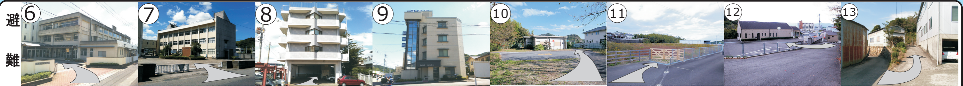
6 論田小学校 7 運転免許センター (平成26年1月移転予定) 8 ウィングコーポ大原 9 林病院 10 大原集会所 11 避難場所 12 ますみクリニック 駐車場 13 長谷川木工所 敷地